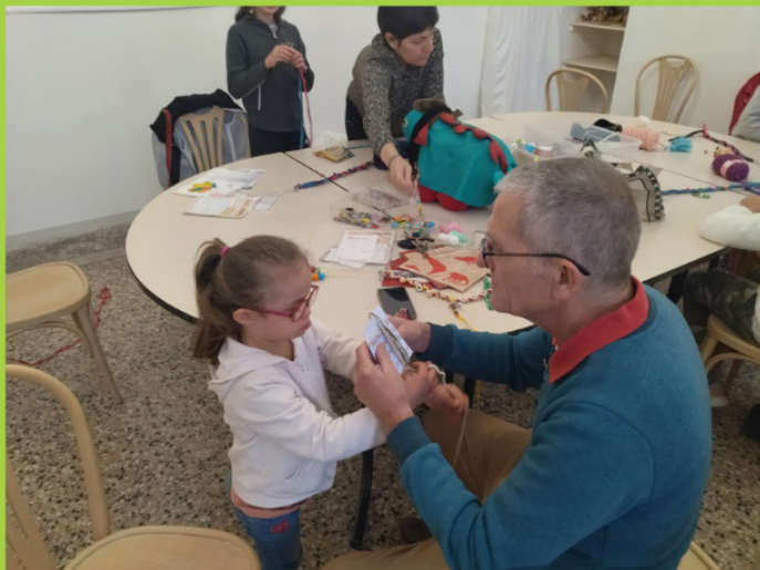
L'atelier une laisse pour la Tarasque