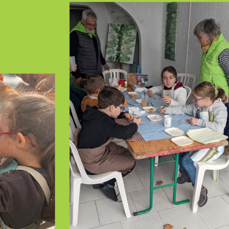
L'atelier peinture sur santons