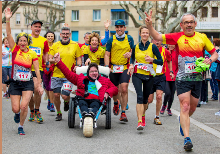
Tous ensemble, nous avons unis nos différences !