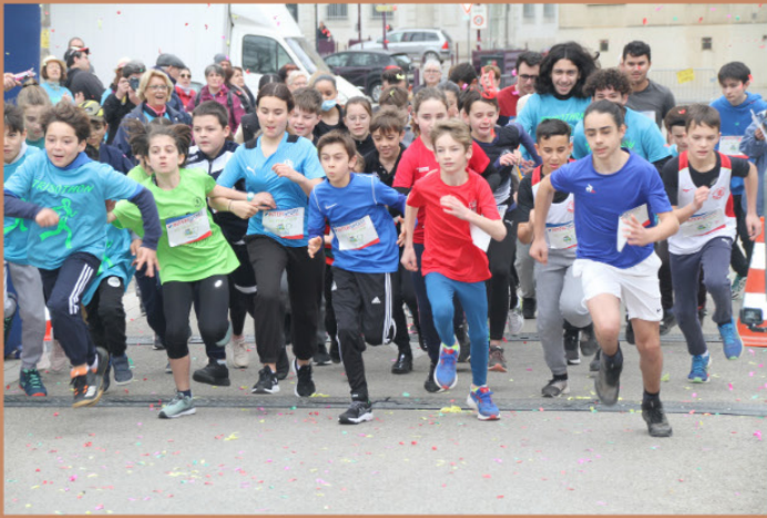
De beaux départs pour tous