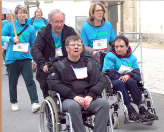
Que de belles équipes!