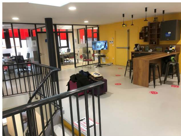
Au 1er, le coin café ouvre l'accès aux différents espaces : bureaux, garderie

Pour cela il va nous falloir veiller à délocaliser les actions d'aide à l'autonomie d'un espace privatif, « le Logement » vers un espace collectif « le Tiers Lieu ».