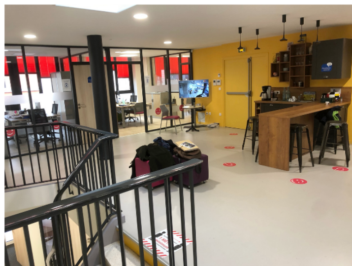
Au 1er, le coin café ouvre l'accès aux différents espaces : bureaux, garderie

Pour cela il va nous falloir veiller à délocaliser les actions d'aide à l'autonomie d'un espace privatif, « le Logement » vers un espace collectif « le Tiers Lieu ».